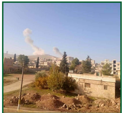
Imágenes de los ataques aéreos en Kobane el 20 de noviembre de 2022

Desde 2012, los habitantes de Rojava y del norte y el este de Siria han iniciado una revolución social y han establecido un sistema de autogobierno. Desde entonces, los éxitos de la revolución se han visto amenazados desde todos los frentes: El ISIS quiere establecer un califato islámico, el régimen de Assad quiere recuperar su poder dictatorial sobre la región y Turquía quiere expulsar a los kurdos de la región para construir un imperio neo-otomano. En pos de este objetivo, Turquía ha ampliado sus ataques contra Rojava y el norte de Siria. Comenzando con una ofensiva militar inicial en 2016-2017, Turquía, con la ayuda de sus propias fuerzas terrestres, así como de ejércitos mercenarios, ocupó las zonas predominantemente árabes alrededor de Al-Bab y Azaz, violando el derecho internacional. Ese mismo año siguió una ofensiva militar en Idlib. En 2018, Turquía atacó y ocupó Afrin con la ayuda de sus grupos mercenarios, compuestos principalmente por facciones islamistas opuestas al dictador sirio Al Assad. Al hacerlo, obtuvieron el control de zonas fronterizas en la parte occidental de Rojava/norte de Siria que son estratégicamente importantes para Turquía, y para la región en su conjunto. La última gran ofensiva militar se llevó a cabo en 2019 con la ocupación de las zonas alrededor de Serê